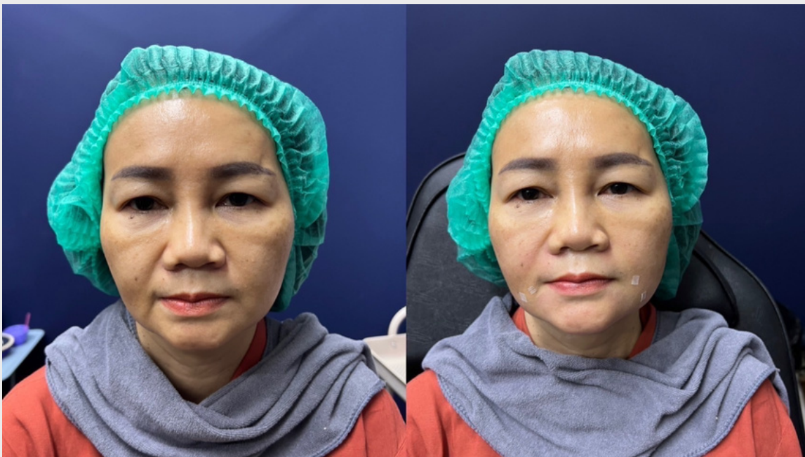
filler NSI fold + marionette line + chin by Juvederm 3 ml