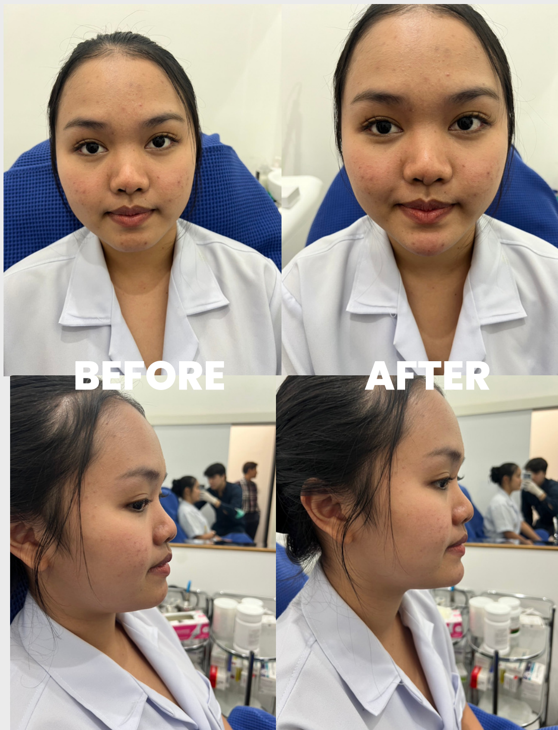
Filler chin by neuramis 1 ml